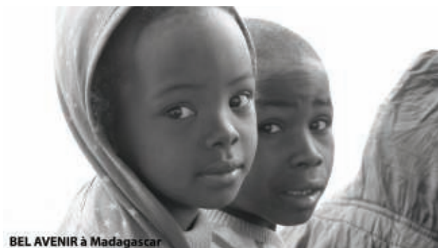
BEL AVENIR à Madagascar

2019 marque le début d'une période de quelques années durant lesquelles nous devrions bénéficier de legs, plus nombreux et parfois importants. Nous remercions du fond du cœur ces marraines et parrains qui poursuivent leur engagement au-delà même de leur vie. Cette fidélité nous engage à poursuivre notre tâche.